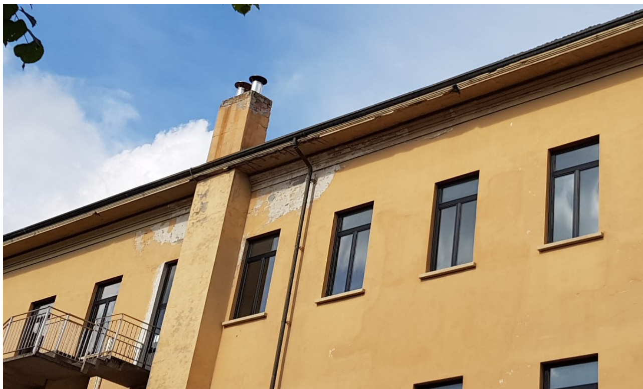
INFILTRAZIONI FACCIATE E CAMINO PERICOLANTE (LATO CORTILE)