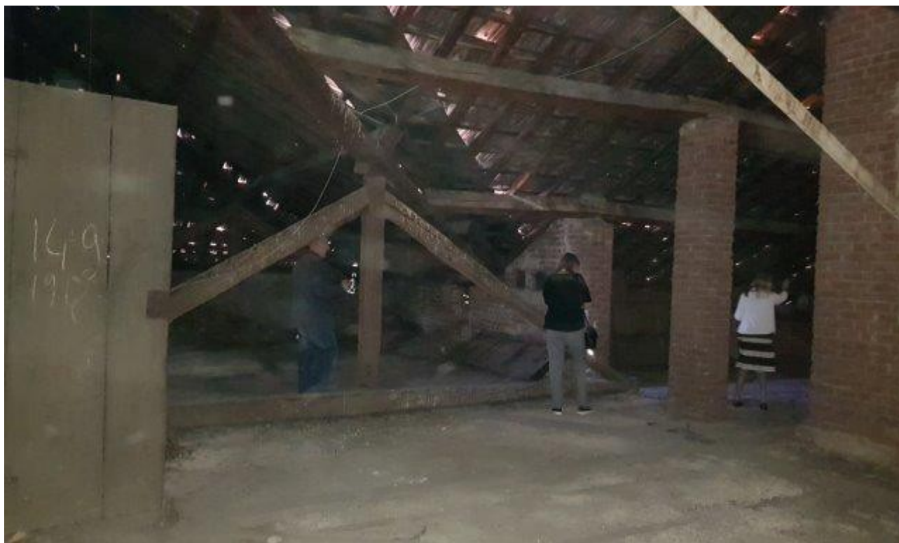
SOTTOTETTO INFESTATO DA PICCIONI, SPORCO E DETRITI