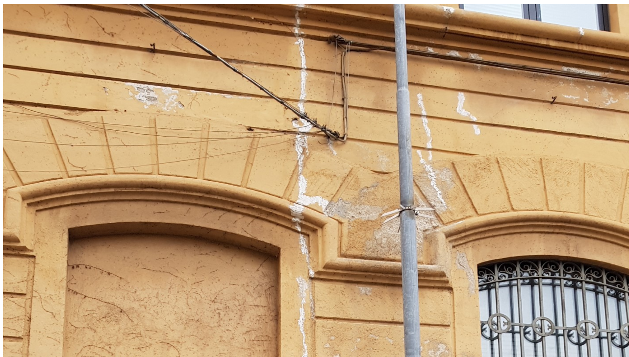
FESSURA PASSANTE FACCIATE (LATO VICOLO GUBBIO)