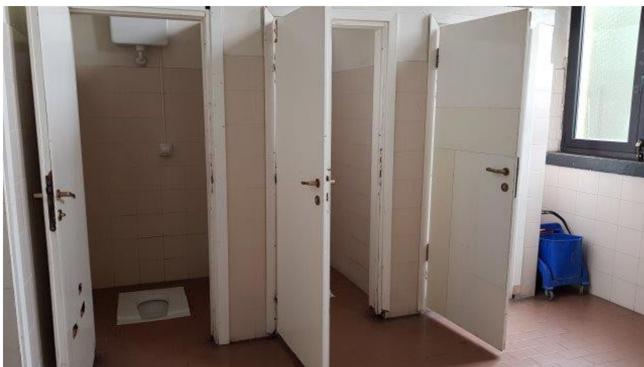
BAGNI LATO NORD