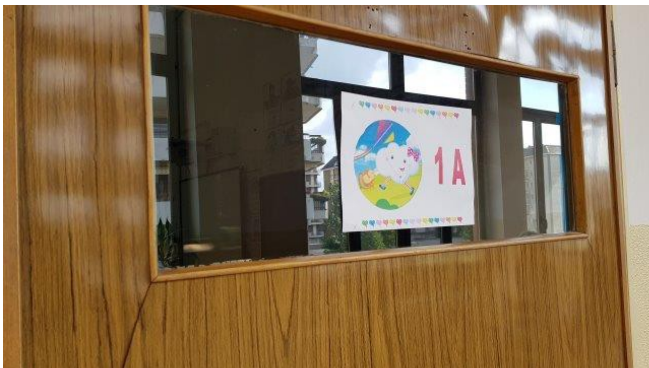
PORTE INTERNE CLASSI-CORRIDOIO CON VETRATE SEMPLICI NON ANTISFONDAMENTO