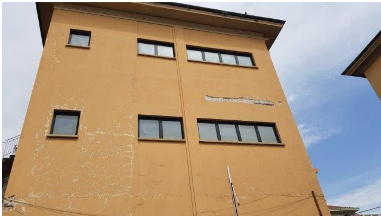
DETERIORAMENTO FACCIATE (LATO CORTILE)