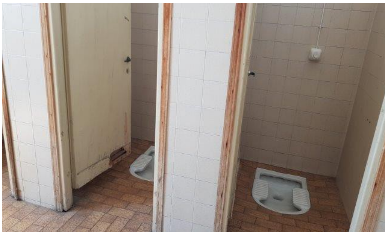
BAGNI LATO NORD