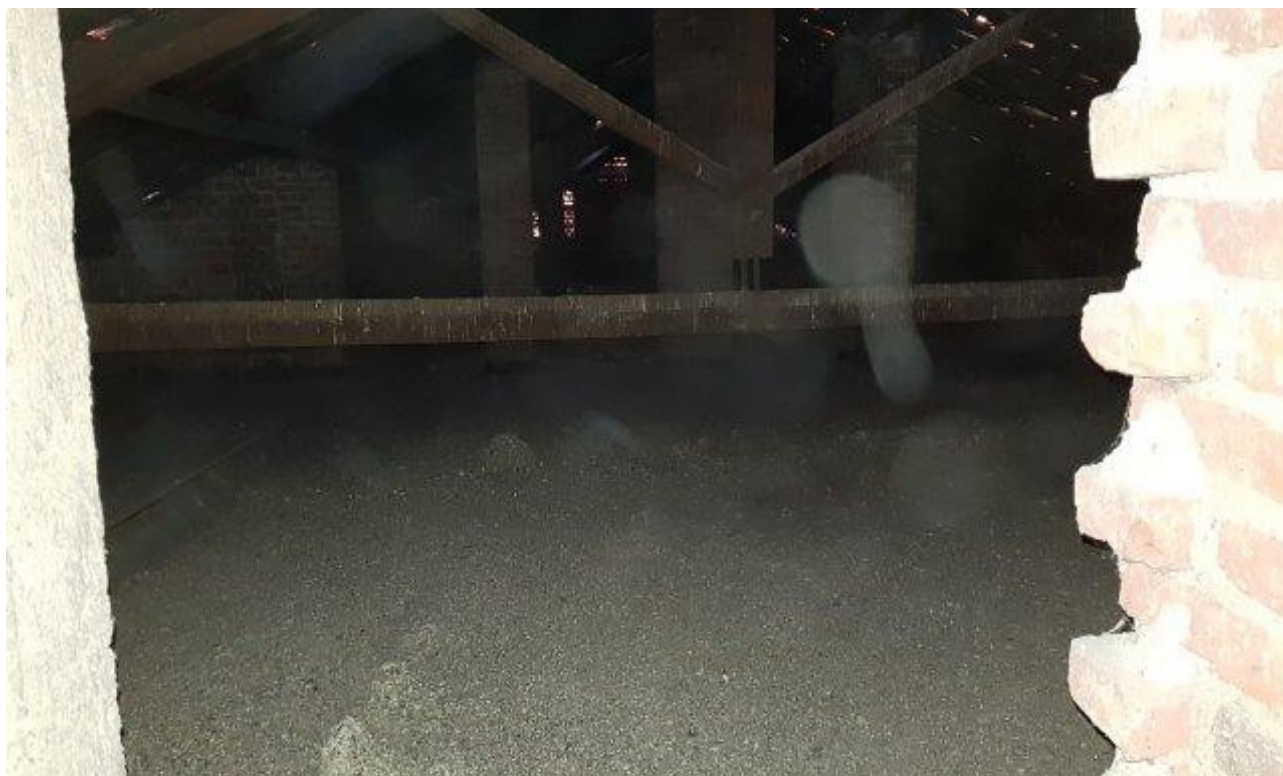
LETTO DI GUANO E PICCIONI MORTI A PAVIMENTO SOLAIO SOTTOTETTO