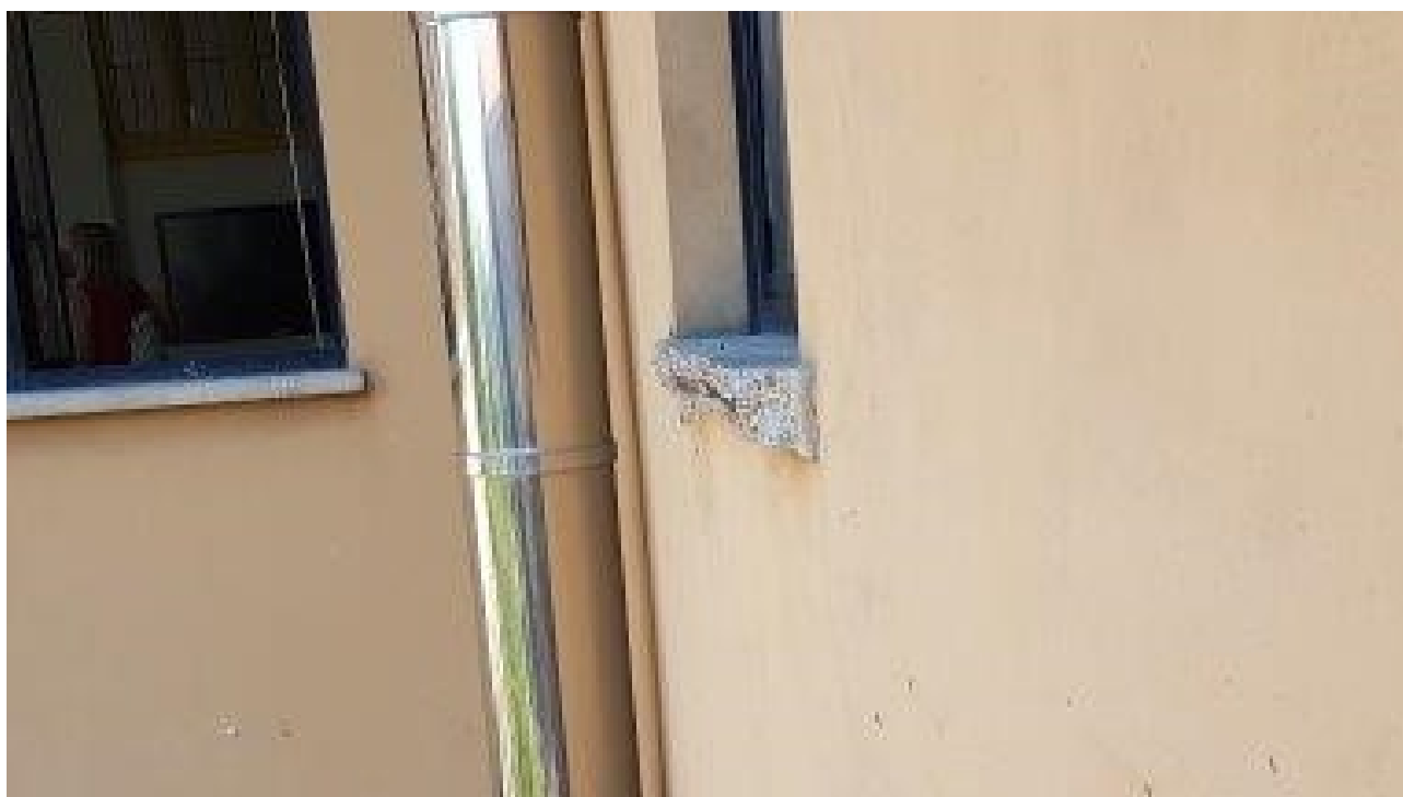
DETERIORAMENTO DAVANZALE SU CORTILE (SECONDO PIANO)