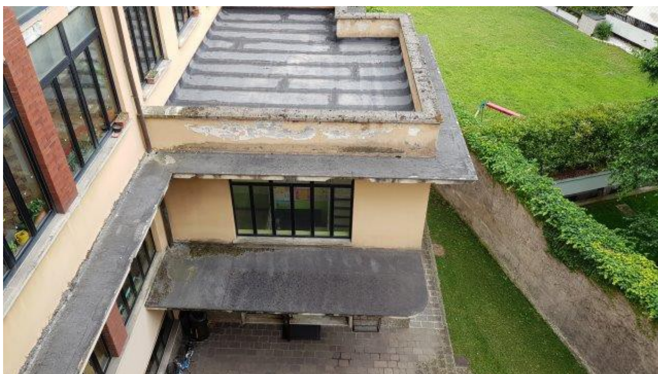
COPERTURA SCALE SCUOLA MATERNA E GRONDA PERIMETRALE