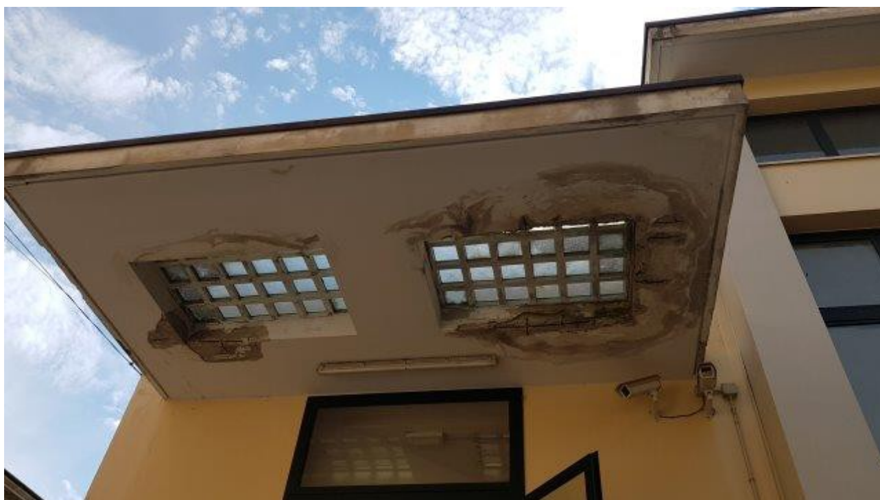
PENSILINA INGRESSO DESTRA PALESTRA PIANO RIALZATO