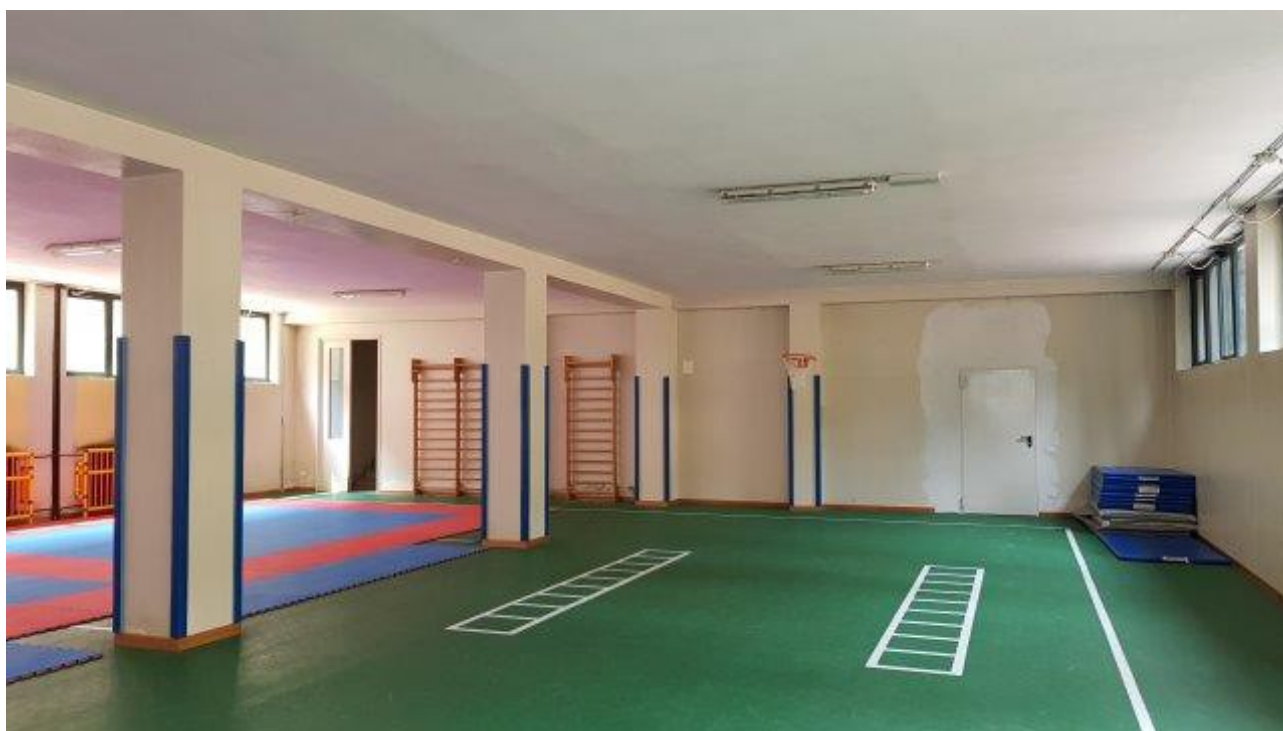
PALESTRA SEMINTERRATA CON UMIDITA' DA RISALITA