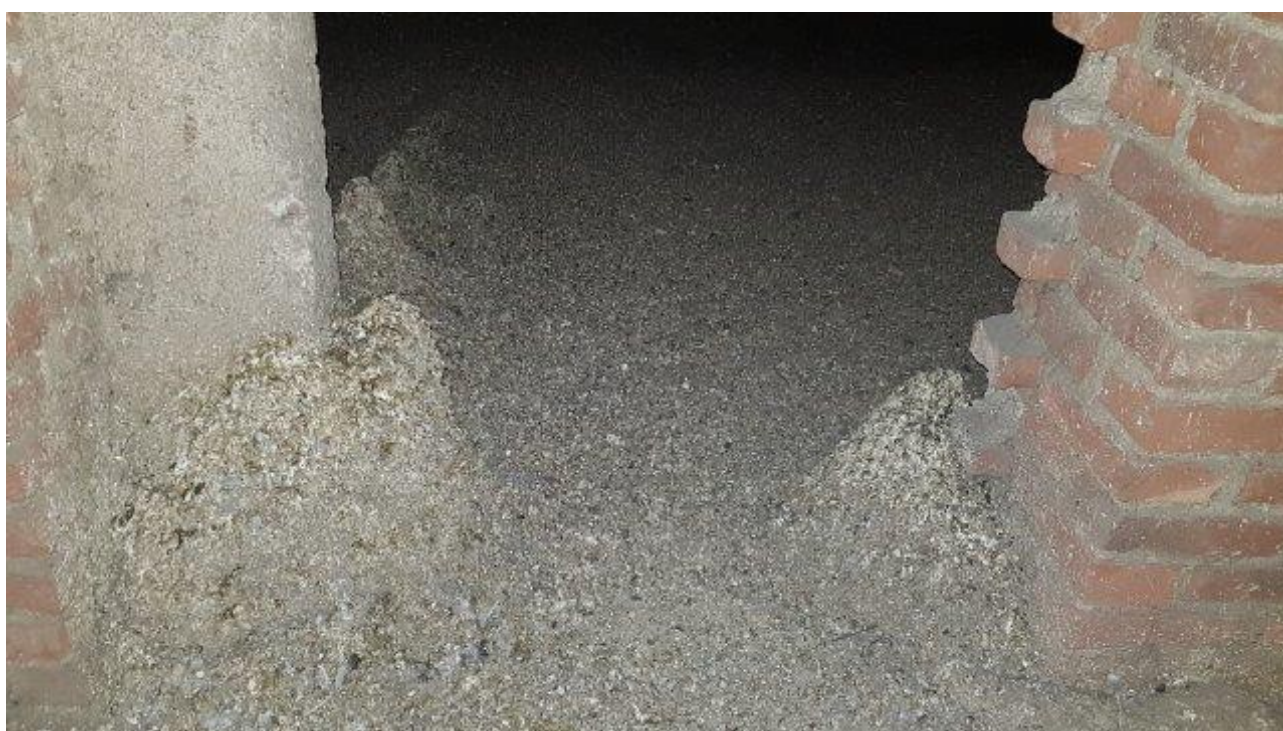
LETTO DI GUANO E PICCIONI MORTI A PAVIMENTO SOLAIO SOTTOTETTO