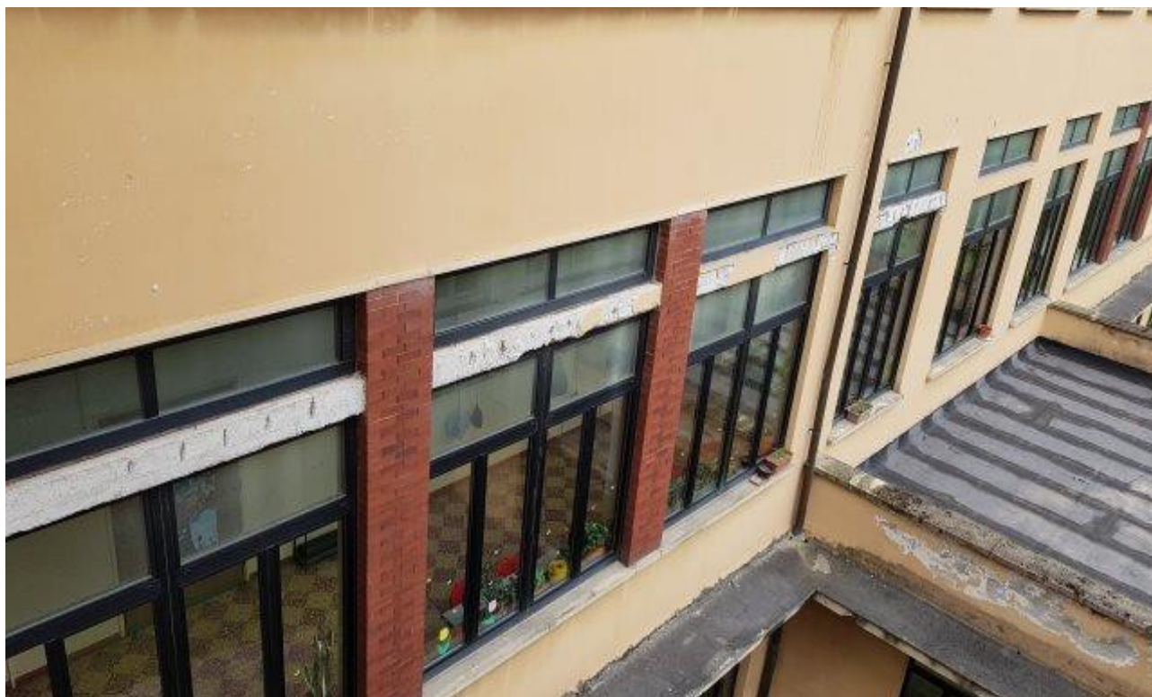
DETERIORAMENTO FERRI TRAVI IN C.A. (SCUOLA MEDIA PRIMO PIANO)