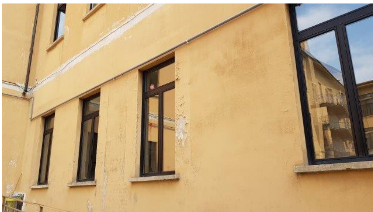
DETERIORAMENTO FACCIATE (LATO CORTILE)