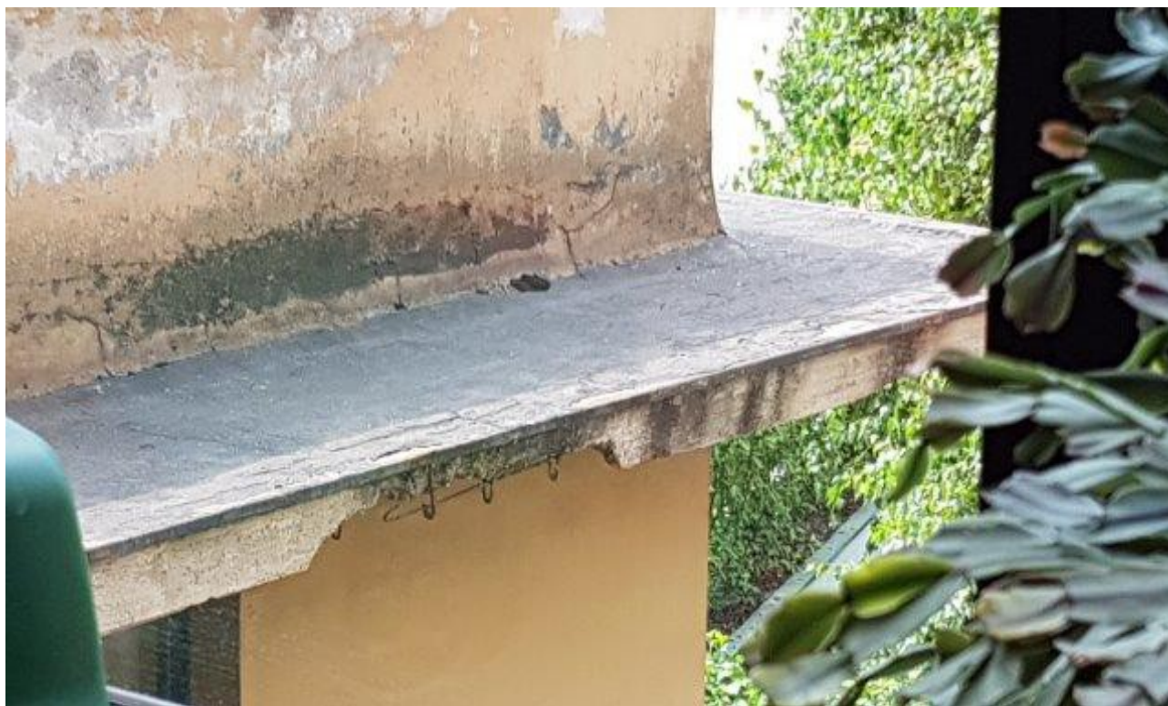
GRONDA PRIMO PIANO SCUOLA MATERNA