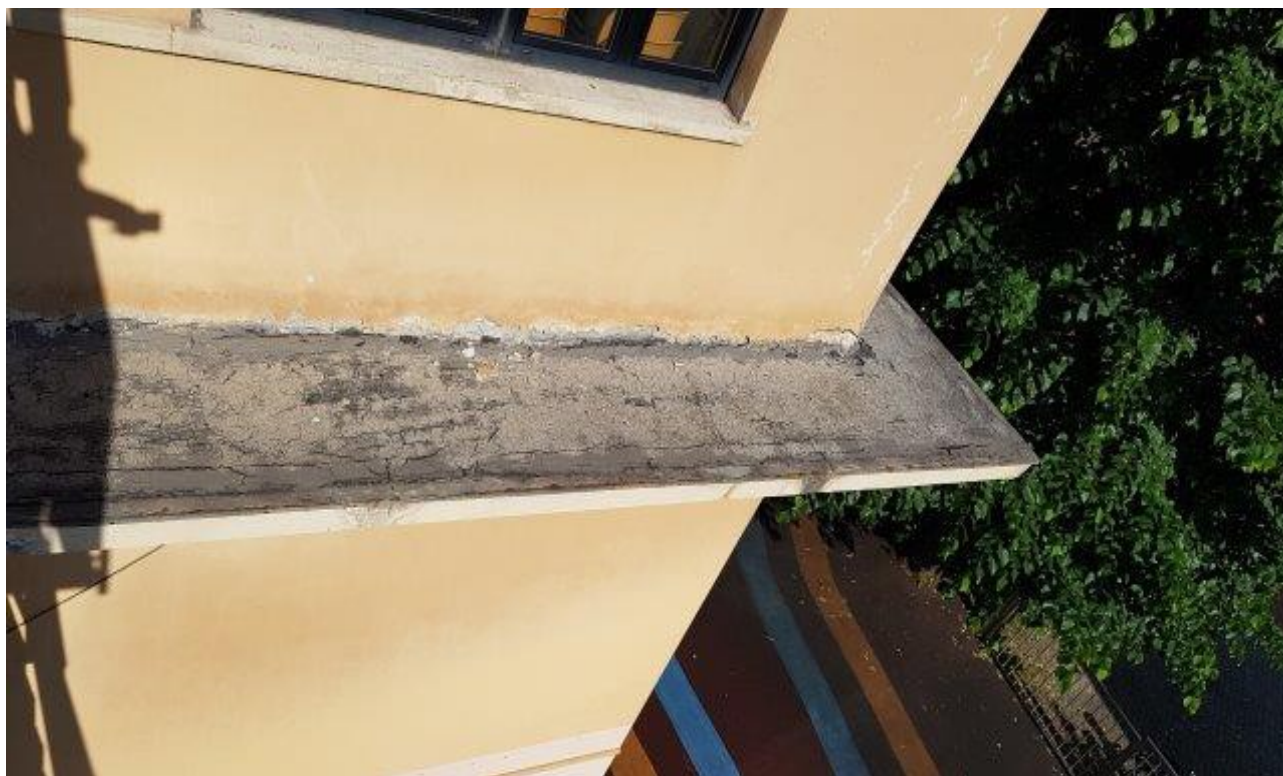
GRONDA PRIMO PIANO SCUOLA MEDIA