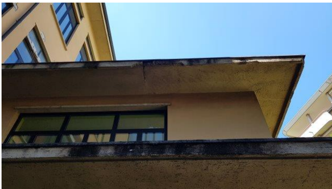
GRONDA INGRESSO E PRIMO PIANO SCUOLA MATERNA