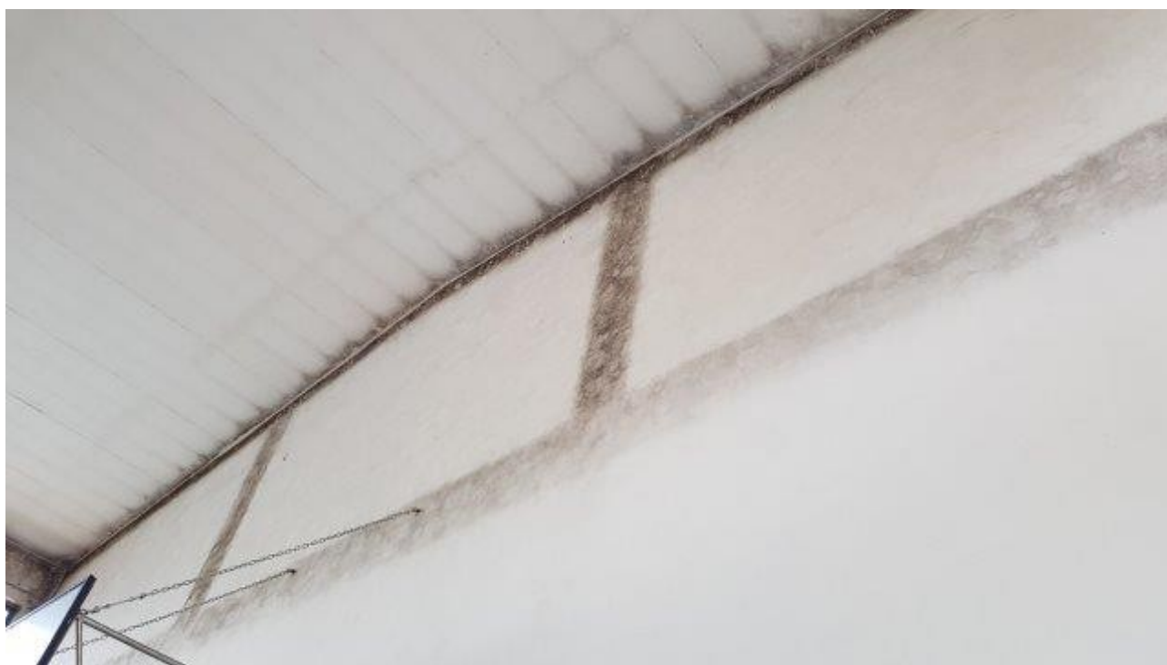
PRESENZA DI MUFFE PER PONTE TERMICO