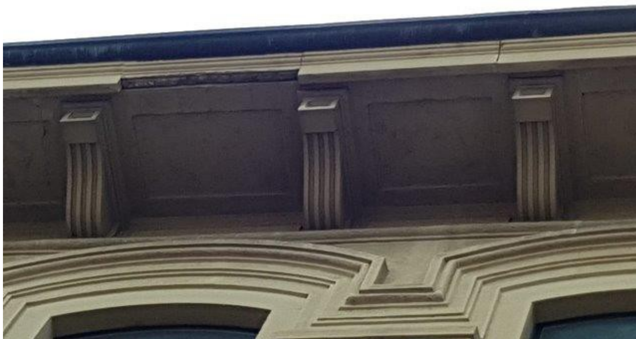
GRONDA DISTACCATA LATO STRADA (ZONA INGRESSO MEDIE)