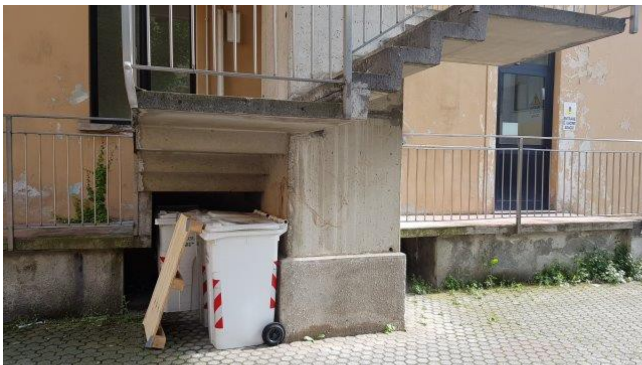
SPIGOLO PIANEROTTOLO SCALA EMERGENZA TROPPO BASSO (170 CM CIRCA)