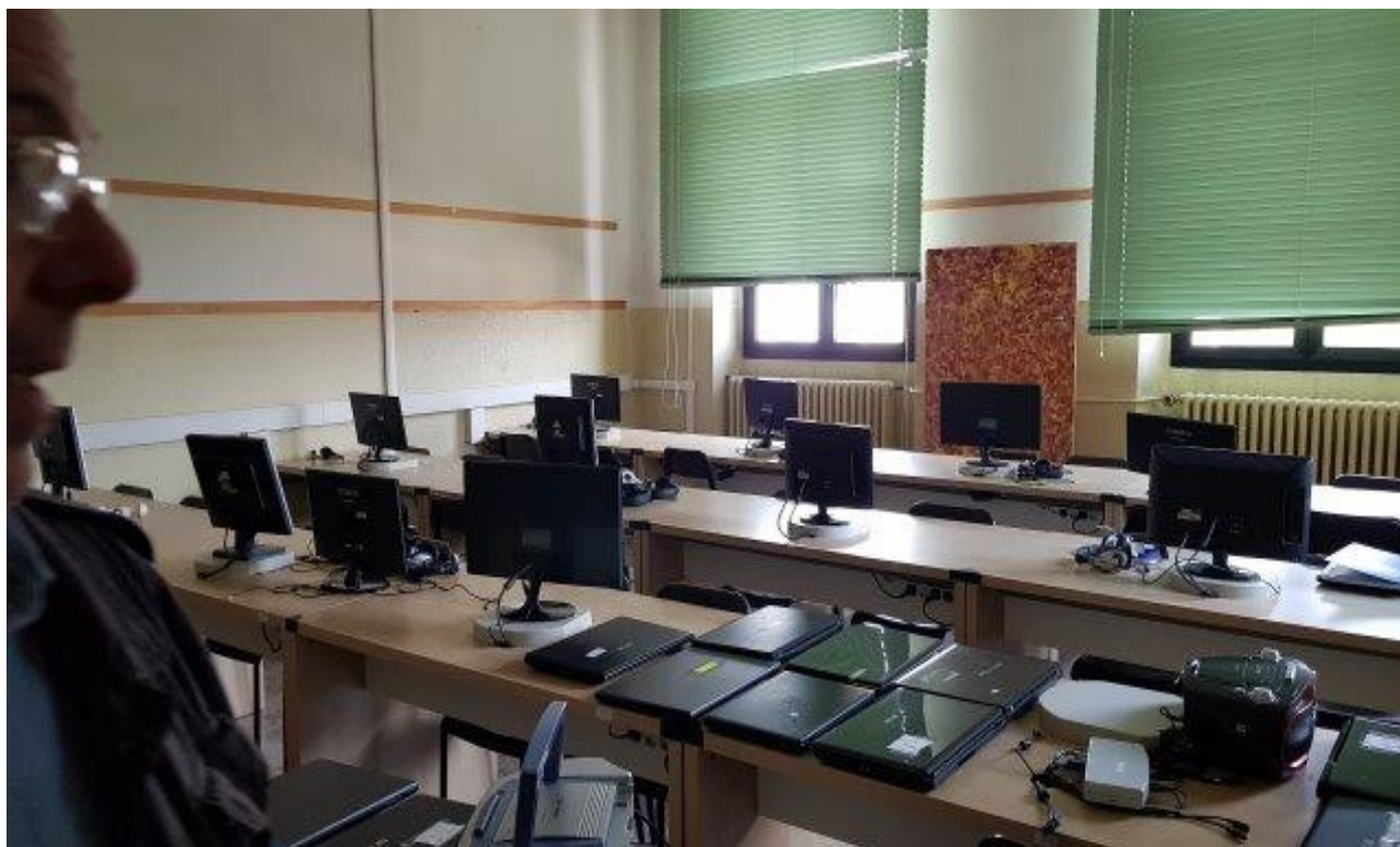
TENDE OSCURANTI (VENEZIANE) NON FUNZIONANTI