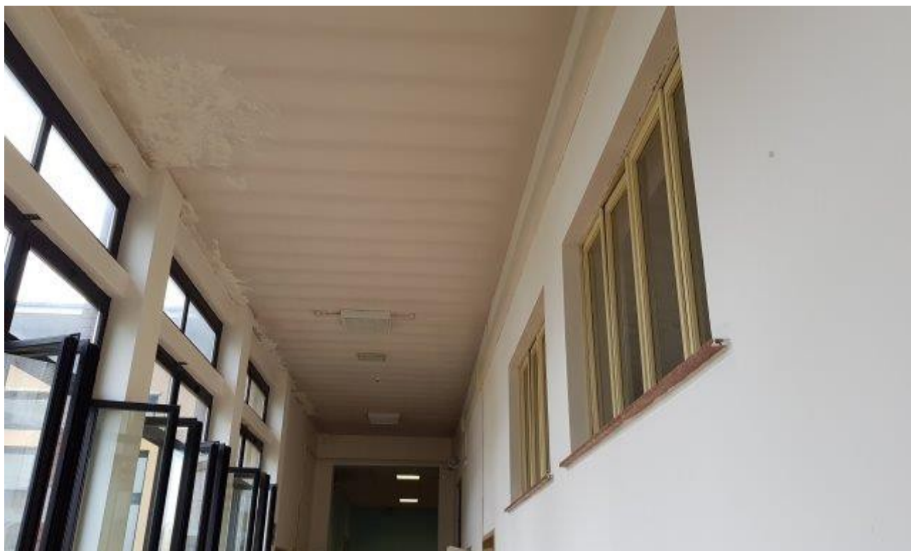
FINESTRE INTERNE CLASSI-CORRIDOIO CON VETRATE SEMPLICI NON ANTISFONDAMENTO