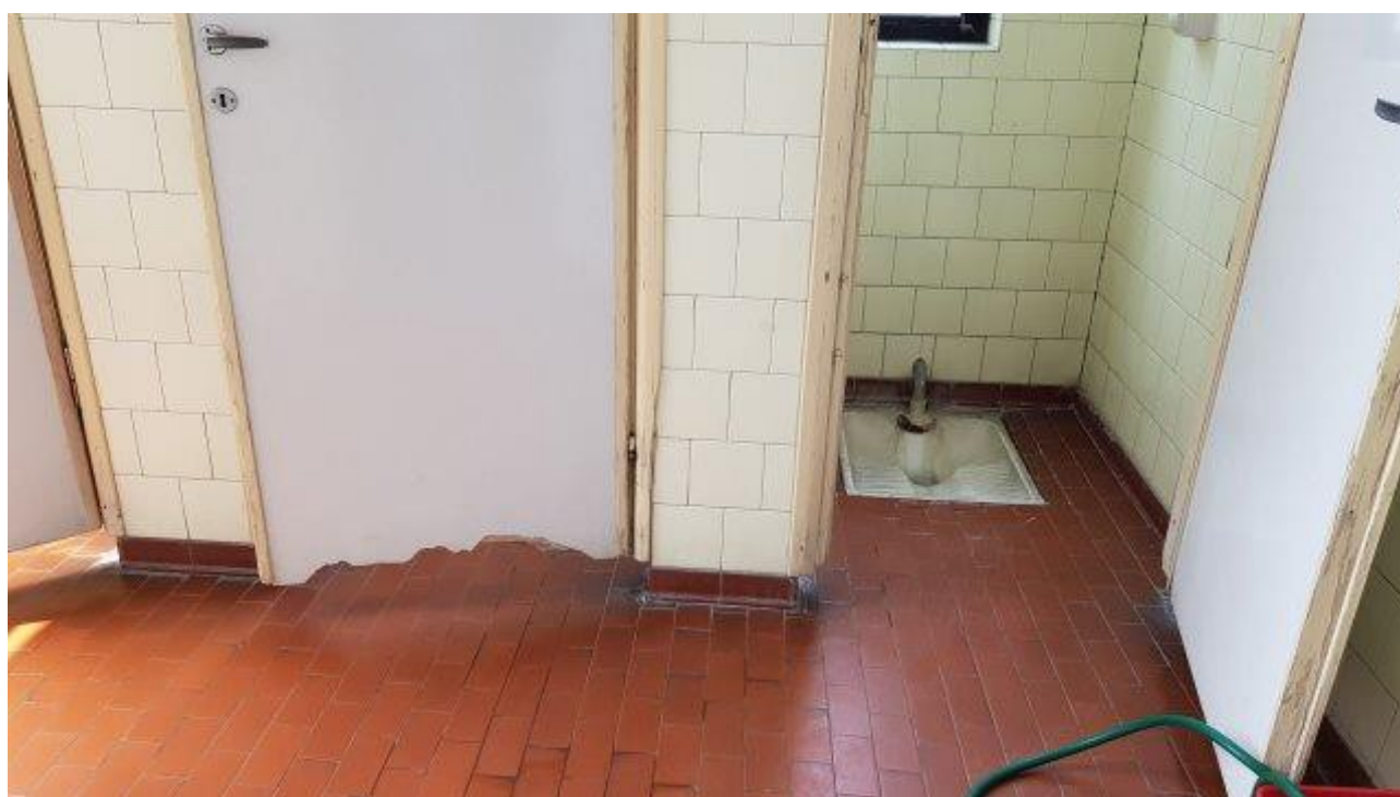
BAGNI LATO NORD