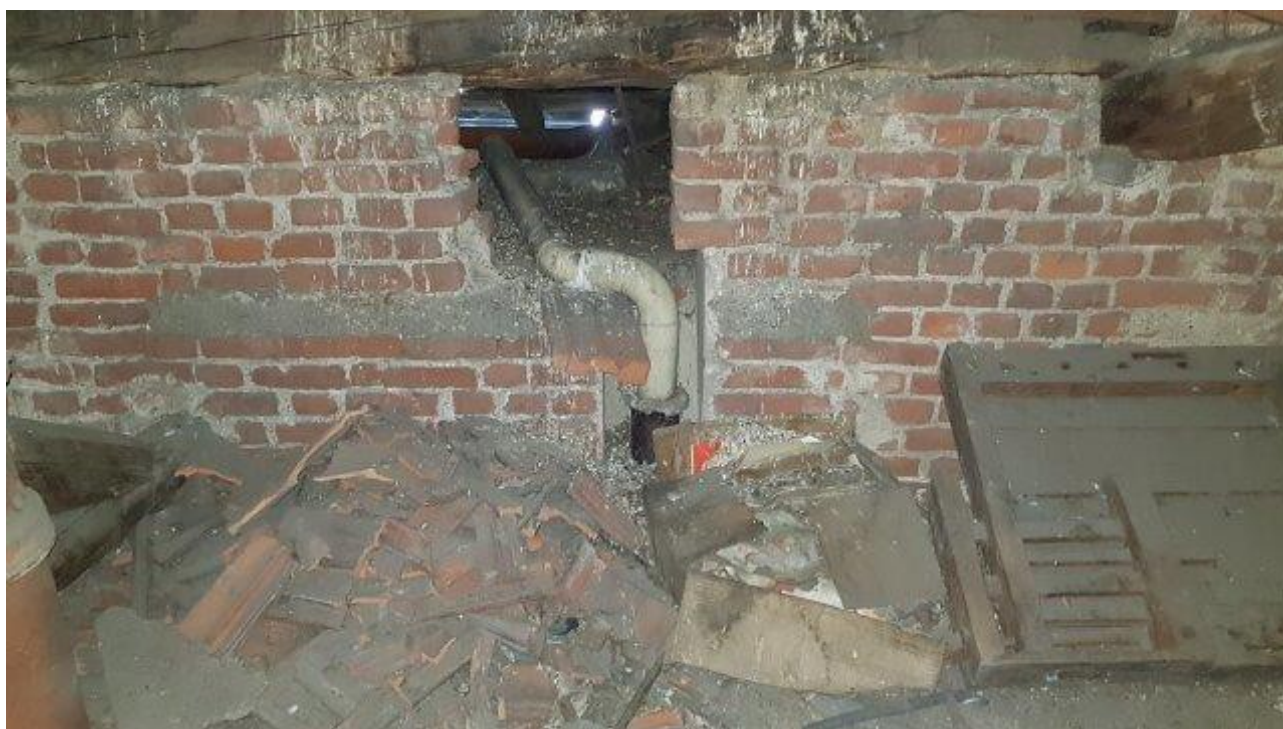
SOTTOTETTO INFESTATO DA PICCIONI, SPORCO E DETRITI