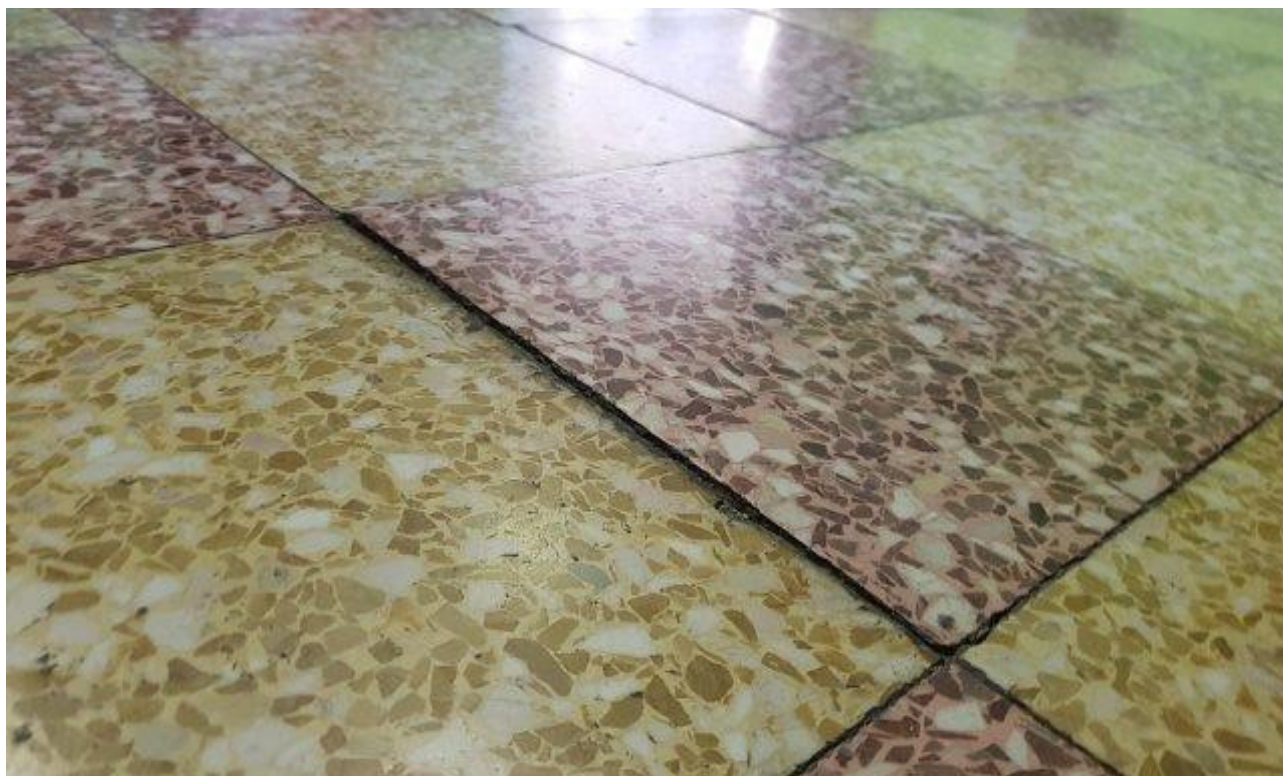
DISLIVELLO TRA PIASTRELLE ZONA ATRIO PRIMO PIANO