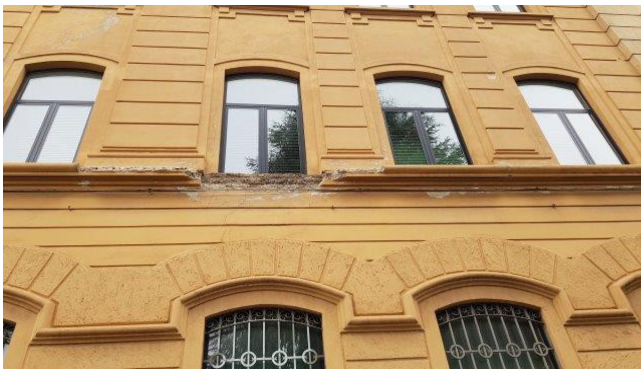
FASCIA MARCAPIANO IN DISTACCO (LATO VIA GUBBIO)