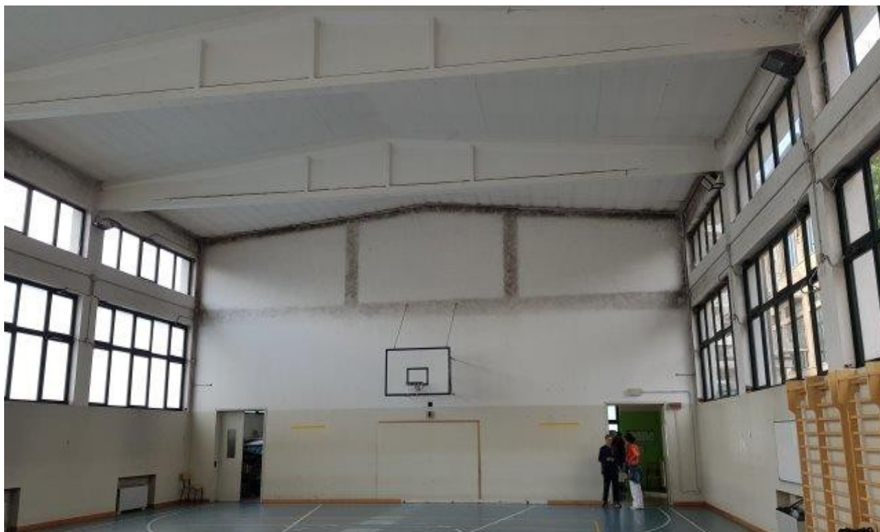
PRESENZA DI MUFFE PER PONTE TERMICO