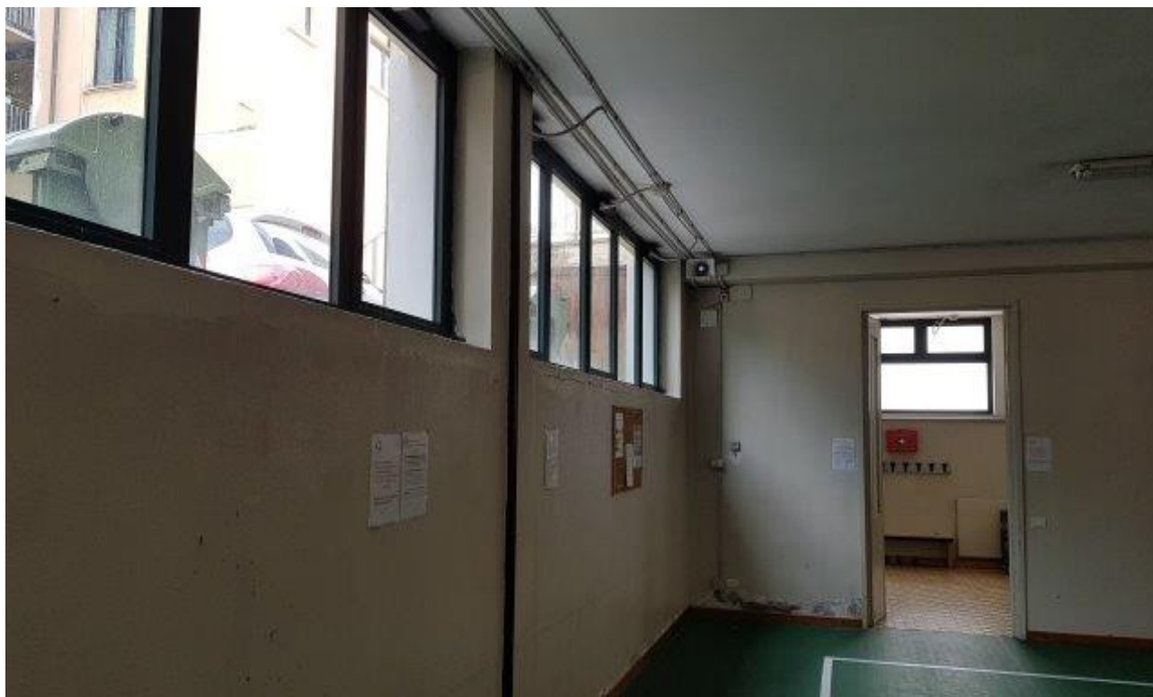
PALESTRA SEMINTERRATA CON UMIDITA' DA RISALITA