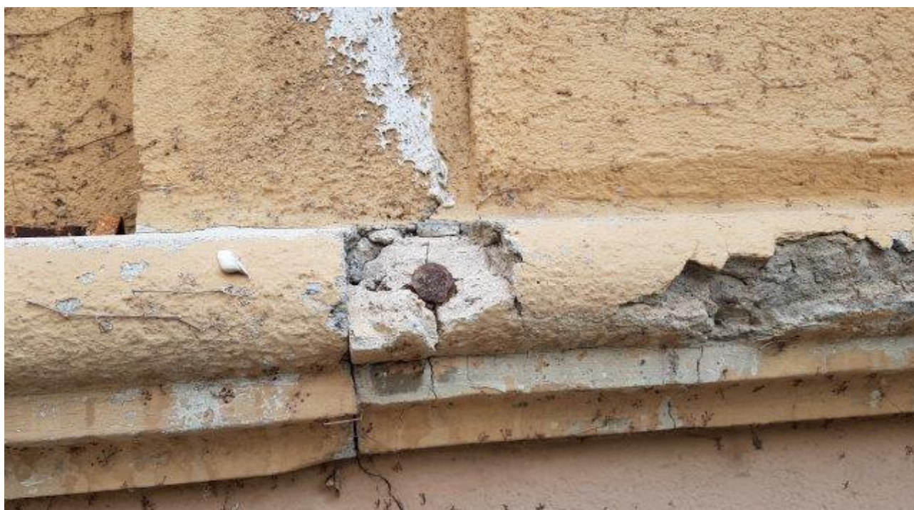
FASCIA MARCAPIANO IN DISTACCO (LATO VIA GUBBIO)